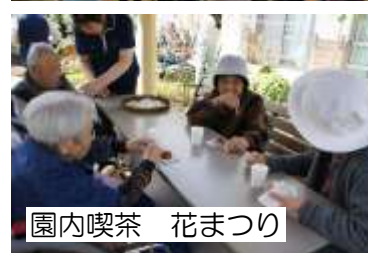
園内喫茶 花まつり