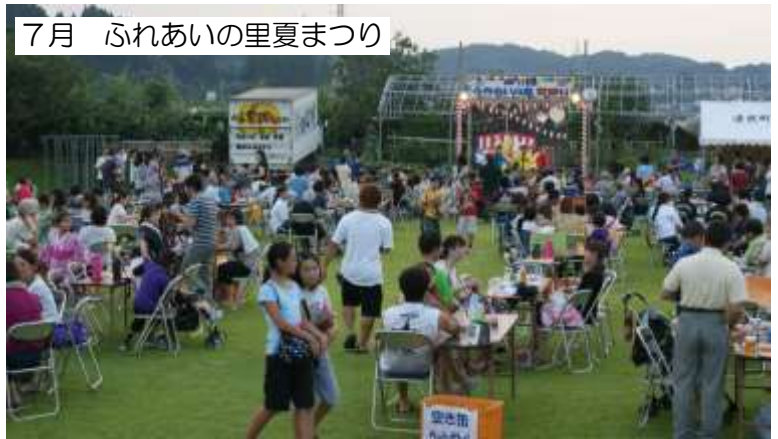
7月 ふれあいの里夏まつり